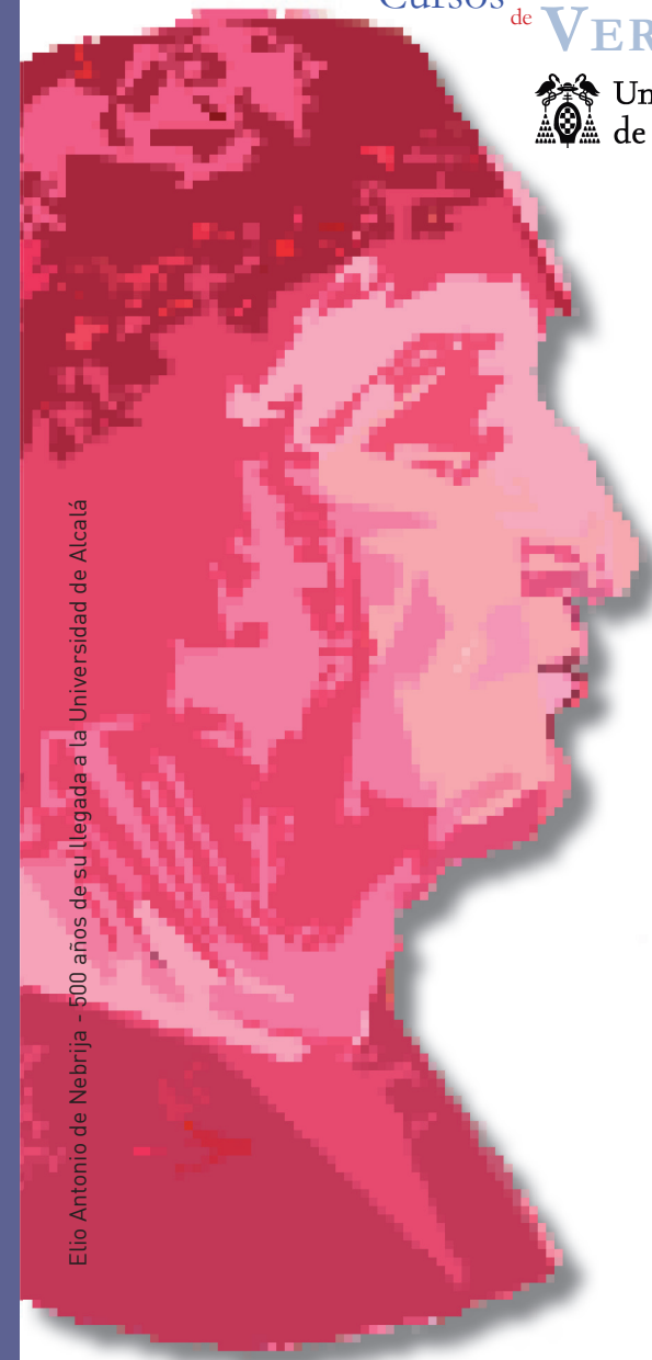
Elio Antonio de Nebrija - 500 años de su Llegada a la Universidad de Alcalá